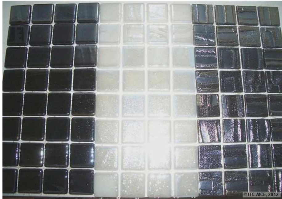
Figura 1 Fotografía de las piezas previo al ensayo (izquierda serie Titanium (780), centro serie Titanium (710), derecha serie Moon).