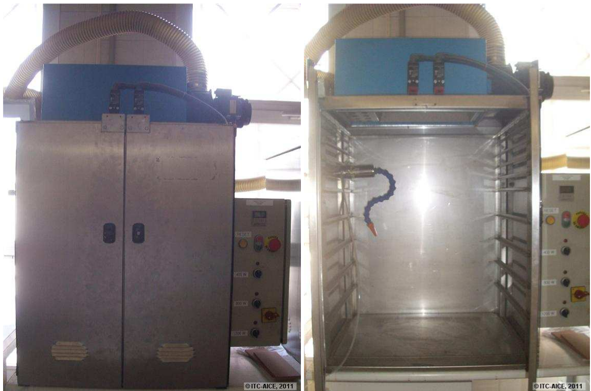
Figura 2 Fotografías de la cámara de insolación de lámpara de vapor de mercurio empleada.