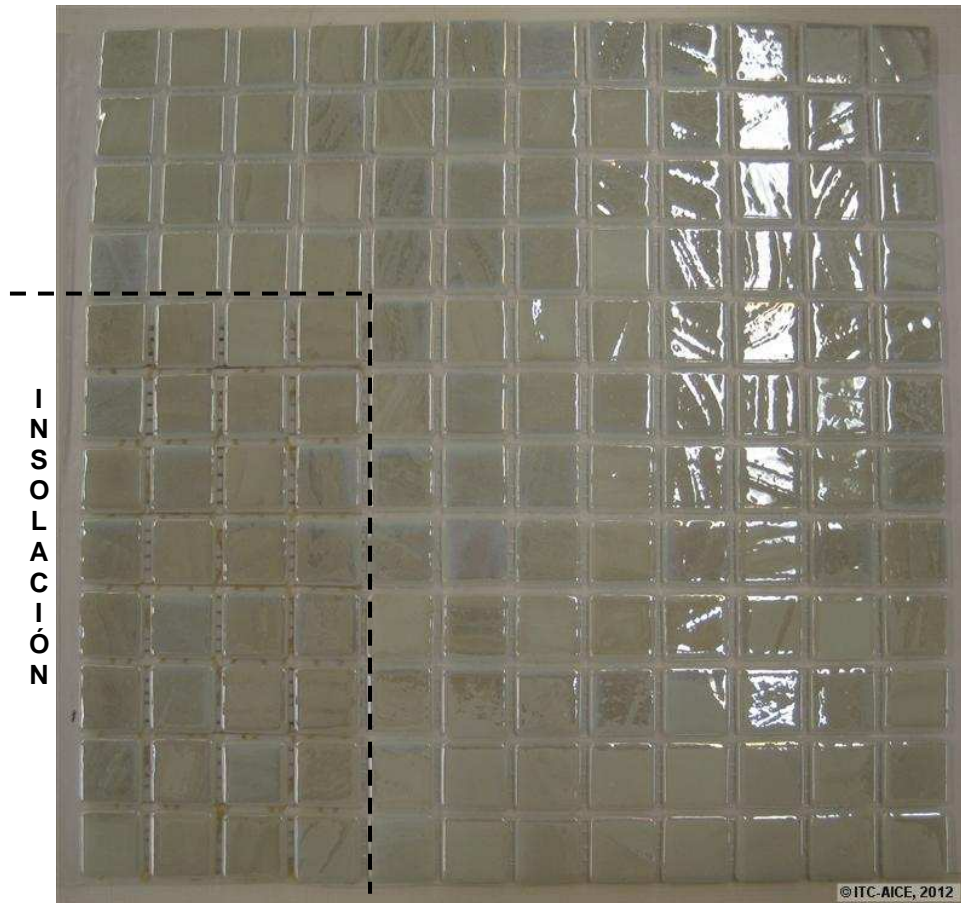
Figura 5 Aspecto de la pieza correspondiente a la serie Titanium (710) con el fragmento sometido a 28 días de insolación.

En todas las fotografías anteriores se observa que no existen diferencias visuales apreciables entre la parte insolada (parte inferior izquierda), y la no-insolada.